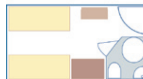
Cabina doble con 2 camas.