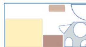
Cabina doble con cama grande